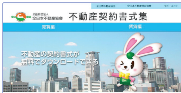
▲ダウンロードページ(現在作成中のため、イメージになります)

契約書は、取引する不動産の種類や取引内容、取引当事者によって細かく分類しています。売買編は28書式、賃貸編は17書式を準備予定しています(2017年2月検討現在)。書式データは法令等の改正等に合わせ随時修正・最新版に更新していきます。