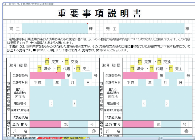
▲直感的に操作できるよう、画面をカラーで色分け